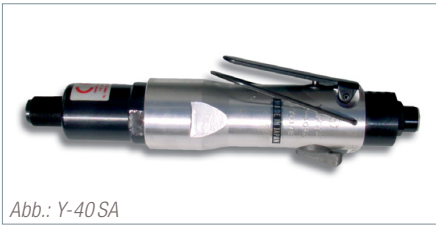
Abb.: Y-40 SA

Yokota Impulsschrauber der Y-Serie sind ähnlich der Baureihe YX, werden jedoch durch einen Doppelkammer-Luftmotor angetrieben. Dadurch wird das eingestellte Drehmoment noch schneller erreicht. Diese Modelle erzeugen eine höhere Anzahl Impulse pro Sekunde und erzielen dadurch eine noch höhere Wiederholgenauigkeit mit einer kürzeren Produktionstaktzeit.