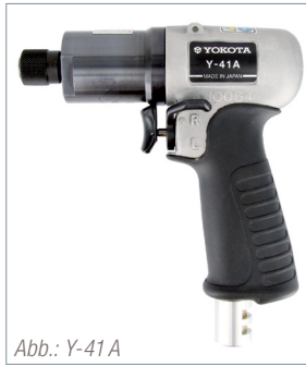
Abb.: Y-41 A

Um alle Vorteile der Impulsschrauber erfolgreich zu kombinieren, ist es sehr wichtig, dass für jede Schraubverbindung der richtige Impulsschrauber verwendet wird. Jede Schraubverbindung ist anders. Wir beraten Sie gern bei der Auswahl des passenden Schraubers für Ihren konkreten Schraubfall.