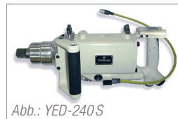
Abb.: YED-240 S

Die TKa-Serie kann optional mit grünen/roten LED anstelle des akustischen Signalgebers geliefert werden (kl. Bilder rechts) – rundum sichtbar: von oben, unten, links, rechts, vorn, hinten.