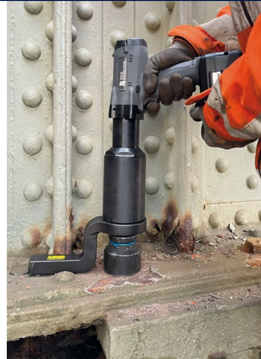
Lösen von korrodierten Schrauben für die Bauindustrie.

Es ist eine Vielzahl von Reaktionsstangen und Halterungen erhältlich, aber wenn Sie eine maßgeschneiderte Reaktionsstange benötigen, können Sie die 3D-CAD-Zeichnungen mit uns teilen.