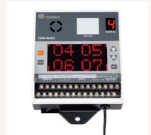
Optional: Anzahlprüfer CNA-4mk3.

Das eingestellte Drehmoment kann nur mit einem Spezialwerkzeug (separat erhältlich) geändert werden, so dass der Bediener das Drehmoment nicht versehentlich ändern kann.