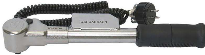
Abb.: QSPCAL S30N