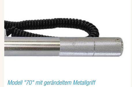
Modell "70" mit geänderten Metallgriff