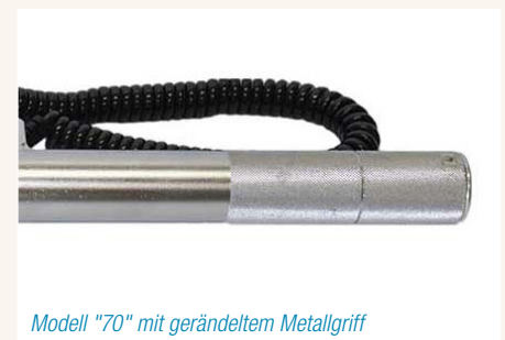
Modell "70" mit gerändeltem Metallgriff