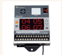
Optional: Anzahlprüfer CNA-4mk3.

Das eingestellte Drehmoment kann nur mit einem Spezialwerkzeug (separat erhältlich) geändert werden, so dass der Bediener das Drehmoment nicht versehentlich ändern kann.