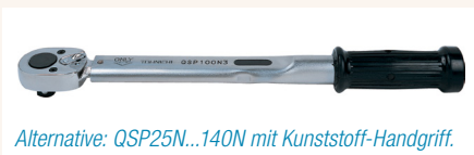
Alternative: QSP25N...140N mit Kunststoff-Handgriff.