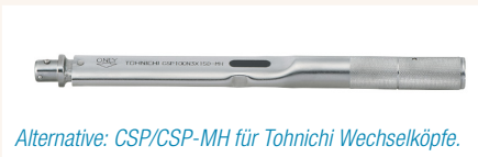
Alternative: CSP/CSP-MH für Tohnichi Wechsellköpfe.