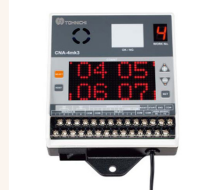
Optional: Anzahlprüfer CNA-4mk3.