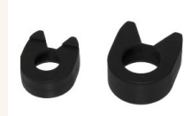
Optional: Schutz-Abdeckung für den Ratschenkopf.

Der Endschalter kann auch an ein CNA-4mk3 Zählprüfgerät (separat erhältlich) angeschlossen werden, um auf einfache Weise ein System zur Verwaltung der Schraubenanzugszahlen zu erstellen.