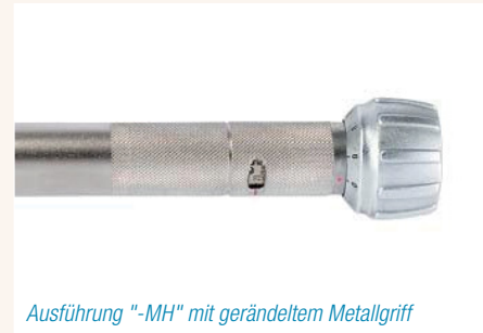
Ausführung "-MH" mit gerändeltem Metallgriff