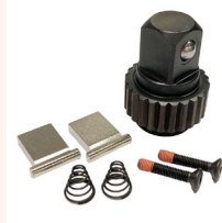
Option: Ratschen-Reparatursatz (je nach Typ/Modell).