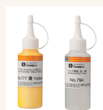
Markertinte/Lösungsmittel sind separat erhältlich.

Zum Einstellen des Drehmoments ist ein passendes Prüfgerät erforderlich. Optional ist voreingestellte Lieferung ab Werk möglich; geben Sie dann bitte das gewünschte Drehmoment in der Anfrage/Bestellung an.