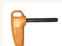
Einstellwerkzeug No. 931 für CMQSP-M6, Einstellwerkzeug No. 930 für CMQSP-M8...M12.